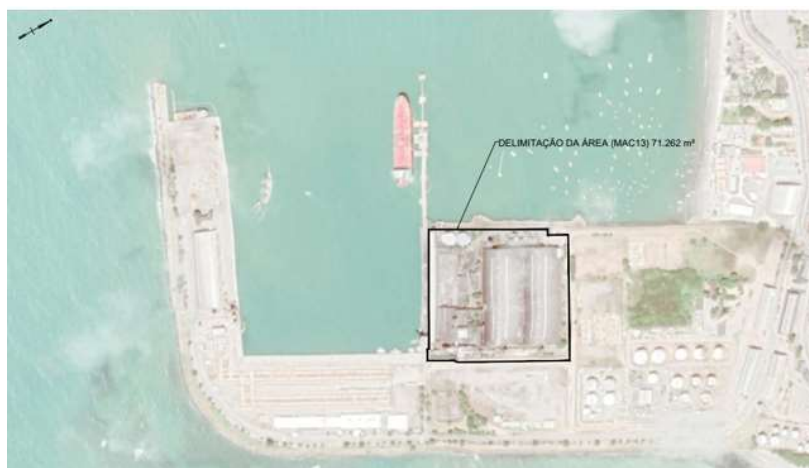
Figura 01: Área de arrendamento MAC13 – Porto de Maceió/AL.

38. Abaixo segue localização da área em questão no Porto de Maceió-AL: