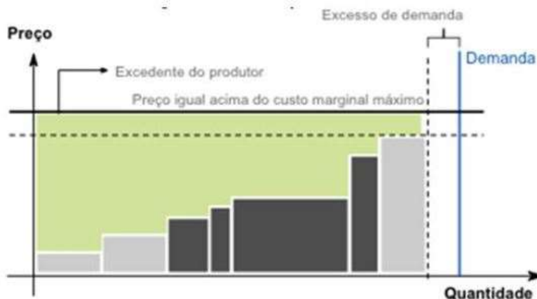
Figura 02: Gráfico Preço x Quantidade.

95. Esse aumento da competição reverte parte do excedente do produtor em ganho aos consumidores e na geração de uma nova estrutura de competição e eficiência para o futuro, conforme ilustrado de maneira simplificada nas Figuras abaixo: